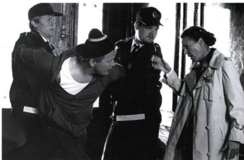
Seuls à la maison

• Avec Seuls à la maison de la Danoise Lone Sherfig, nous ne sommes pas dans le monde merveilleux de vous savez qui. Il y a de l'ironie et de l'impertinence sur pellicule. Il ne s'agit pas d'un film charmant. Comme toute bonne famille qui respire l'air de son temps, celle de Kasper, Sara et Julie, est monoparentale. Les finances sont dans un état lamentable. C'est bien connu, les adultes veulent toujours le bien de leurs enfants. Mais certains s'y prennent mal. Ici, la maman s'adonne au vol à l'étalage. Elle en fait une sorte de jeu de cache-cache avec ses propres enfants. Pour se venger d'un refus, Kasper fait pipi dans les bottes d'un deuxième papa absent. Vous avez dit édifiant? Un film pour jeune public averti des dangers que peuvent présenter certains adultes et certains enfants.