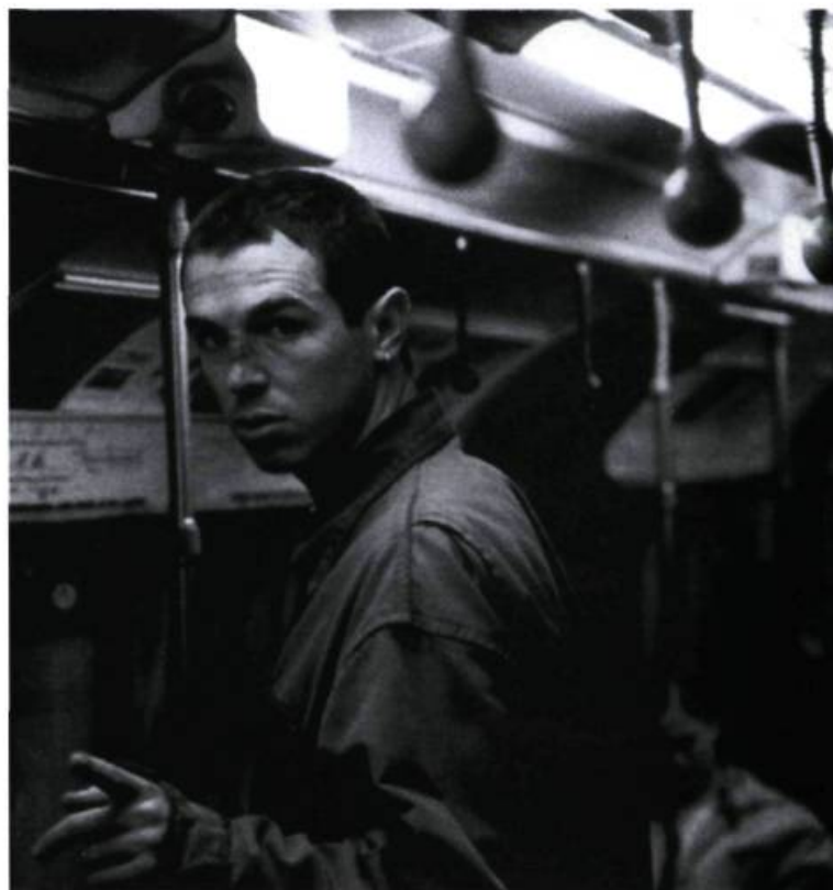
Nil By Mouth

Les souleries de Ray, les piqûres de Billy, leurs chasses aux substances psychotropes et leurs incontrôlables désespoirs forment le train-train des femmes de leur vie. Mère, femme, sœur, fille, grand-mère, nulle n'est à l'abri des colères de l'homme: elles encaissent en silence. Pour Oldman, les femmes sont les piliers de la famille brisée, les hommes se mouvant entre la prison et les pubs. Et pourtant, Nil By Mouth est dédié à la mémoire de son père. Sans doute pour souligner que, tout comme pour ce dernier et les figures paternelles ancestrales, il s'est écorché vif et a bouleversé les siens en apprenant à s'assumer comme homme.