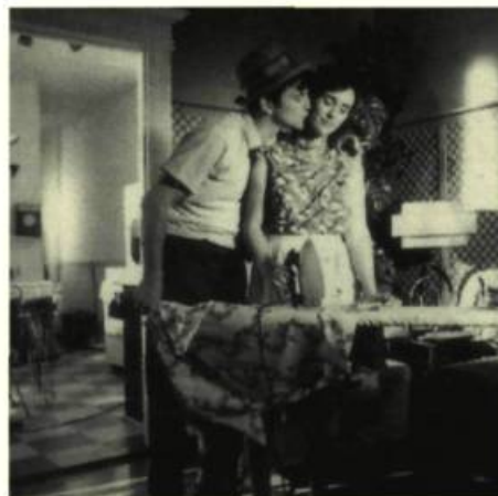
Les Fleurs magiques

Je me rends compte que je ne parle pas beaucoup des films que Sylvain Garel et son équipe ont retenus pour leur événement. C'est que vous les connaissez déjà, la programmation du Festival de Blois ressemblant beaucoup à celle des