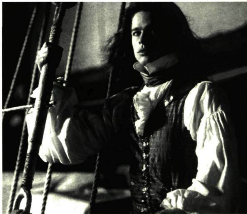
Interview With the Vampire

l'argent des studios se révèle souvent essentiel à l'aboutissement de grands films fantastiques. En réalisant Interview With the Vampire , Neil Jordan avait besoin de son budget colossal pour concrétiser sa vision. Les décors somptueux, les images de synthèse, les maquillages spéciaux, les fabuleux costumes, la remarquable photographie, seul le pouvoir financier de Hollywood peut se les permettre. La présence d'un studio comme Warner Bros. n'a pas empêché Jordan de faire preuve d'une certaine audace. Il parvient à créer des moments d'horreur véritable, comme la scène où Lestat s'amuse cruellement avec deux de ses victimes, ou celle où il valse avec le cadavre de la mère de Claudia, ou la performance du Théâtre des Vampires au cours de laquelle une jeune femme est sacrifiée devant un auditoire mystifié.