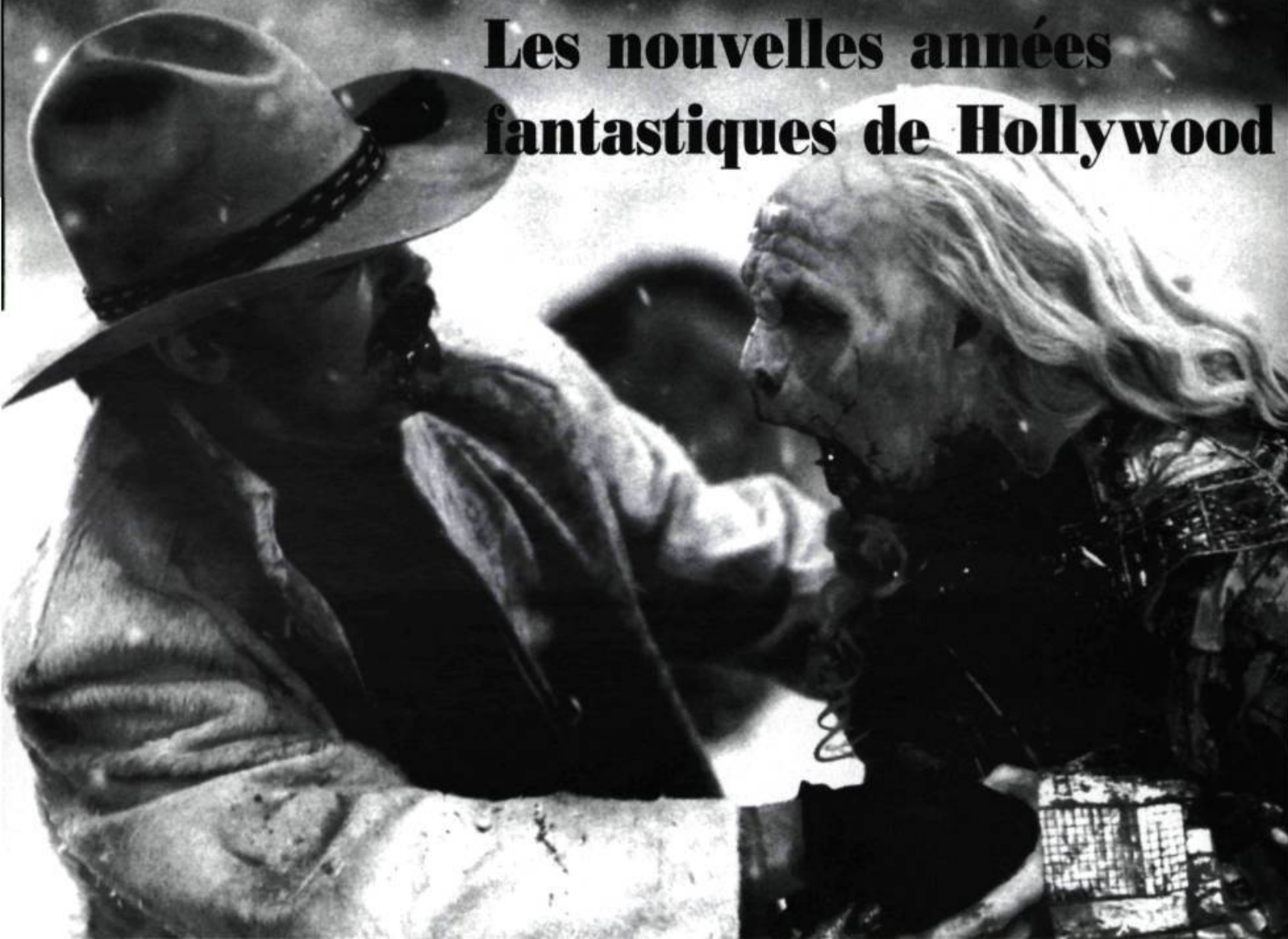
Bram Stoker's Dracula

D racula, Frankenstein, loup-garou, vampires, homme invisible, fantômes. Il ne manque à cette liste qu'une momie (ça s'en vient...) et Mr. Hyde (c'est pour bientôt...) pour que Hollywood ait une fois de plus fait le tour de tous les sujets fantastiques auxquels les grands studios reviennent inlassablement, de façon cyclique, depuis la grande époque des films Universal des années 30. Cette fois-ci, ce nouveau nouvel engouement a été déclenché par l'étonnant succès de Bram Stoker's Dracula , la plus récente version de ce roman à être portée à