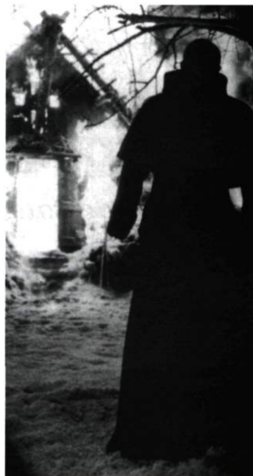
Mary Shelley's Frankenstein

Si l'horreur subit les contrecoups de cette tendance à la récupération des vieux thèmes éculés, la science-fiction souffre également du paradoxe hollywoodien. Souvent, l'argent permet de camoufler le manque de talent véritable et d'idées originales. Si l'horreur traverse une crise d'identité, puisque très peu de films cherchent vraiment à nous effrayer ou à nous choquer, le film de science-fiction s'évanouit derrière l'om-