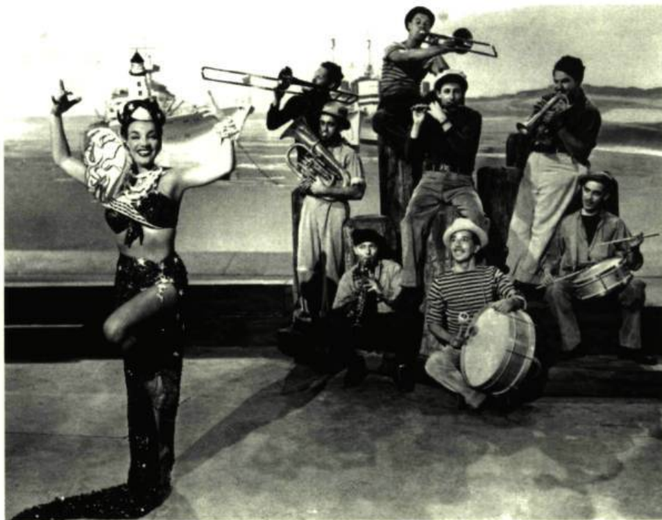
Carmen Miranda: Banana is my Business

et aussi: Chariots of Fire (Hugh Hudson), Mephisto (István Szábo), Les Années de plomb (Margarethe von Trotta), Ragtime (Miles Forman), La Femme d'à côté (François Truffaut), Smash Palace (Roger Donaldson), Raiders of the Lost Ark (Steven Spielberg), Garde à vue (Claude Miller), L'Homme de fer (Andrzej Wajda), Les Uns et les autres (Claude Lelouch), My Dinner with André (Louis Malle), Gallipoli (Peter Weir), Coup de torchon (Bertrand Tavernier), Pixote (Hector Babenco), La Guerre du feu (Jean-Jacques Annaud), Céleste (Percy Adlon), Excalibur (John Boorman), Das Boot (Wolfgang Petersen), Christiane F. (Uli Edel), Le Faussaire (Volker