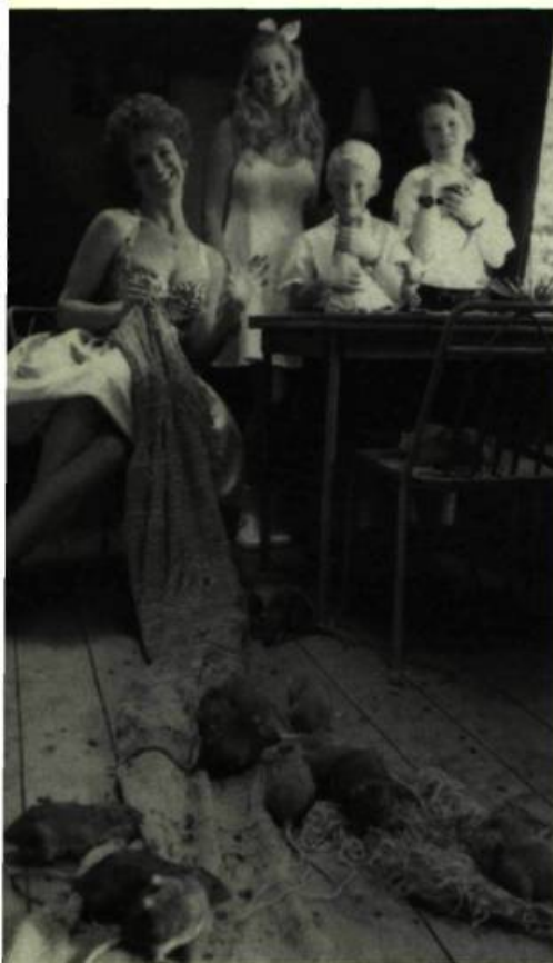
Le Pensionnat Oskar

Liste noire a deux principales raisons d'être. D'abord entraîner le spectateur dans un suspense policier à rebondissements et, en même temps, brosser un portrait peu flatteur des membres de l'autorité judiciaire québécoise. Dans les deux cas, le résultat laisse à désirer.