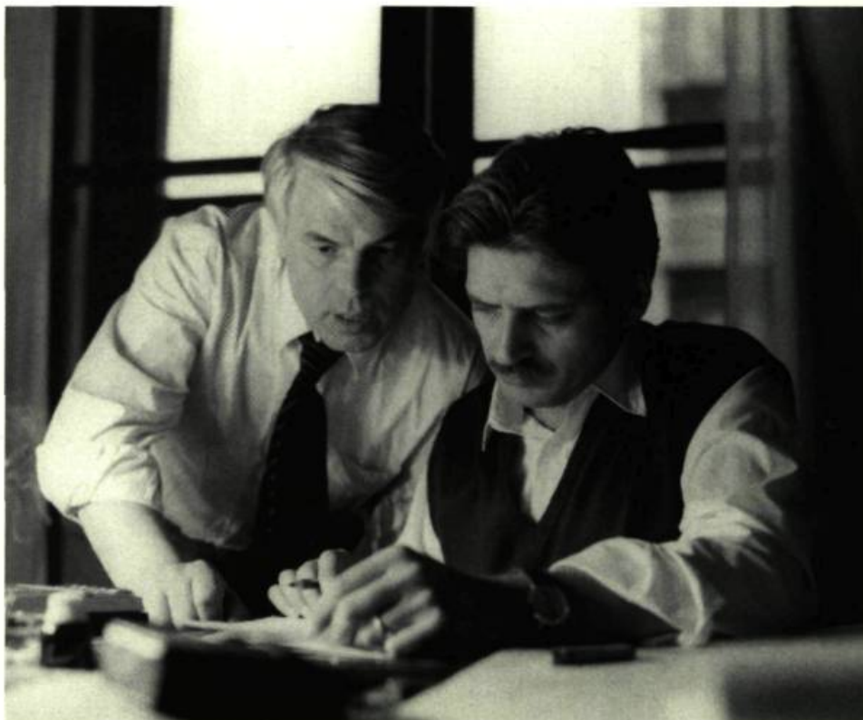
Un héros ordinaire

et aussi: Kwaidan (Masaki Kobayashi), Prima della rivoluzione (Bernardo Bertolucci), Gertrud (Carl Theodor Dreyer), Vidas Secas (Nelson Pereira dos Santos), Shakespeare Wallah (James Ivory), Le Désert rouge (Michelangelo Antonioni), La Peau douce (François Truffaut), Le Journal d'une femme de chambre (Luis Buñuel), La Femme des sables (Hiroshi Teshigahara), Les Parapluies de