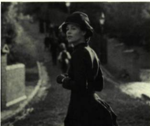
Feast of July