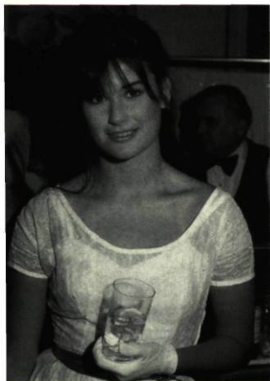
... et de tromper son monde