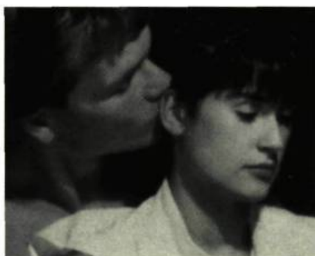
Avec Patrick Swayze dans Ghost

D'ailleurs, elle fera bien pire en acceptant dans Disclosure le rôle de prédateur sexuel, acharné sur la pauvre victime qu'est Michael Douglas. De chassée, elle devient chasseur. Un juste retour des choses en somme. Pour sa défense, elle dira qu'elle aime les rôles qui suscitent la controverse, forcent la réflexion (!!). Mais que des femmes souffrent de l'image qu'elle projette, qu'elles ne soient plus crédibles aux yeux du public lorsqu'elles dénoncent le harcèlement dont elles sont victimes dans la réalité, ne semble guère l'affecter. La responsabilité morale des acteurs n'est jamais qu'un mythe. Et maintenant, Moore s'offre le rôle de la puritaine fautive Hester Prynne, qu'elle incarne dans The Scarlet