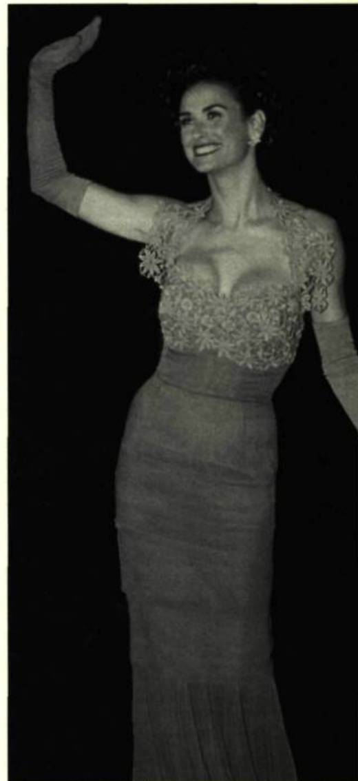
De l'art de savoir se mettre en valeur...

Dans les années 80, Moore n'est rien de plus que la nymphette de service, l'adolescente sans épaisseur. Hormis son rôle dans St-Elmo's Fire , pour lequel elle se voit attribuer le personnage de la frondeuse rebelle, bombe sexuelle farouchement indépendante mais tellement vulnérable, rien ne laissait supposer qu'elle se distinguerait du brat pack dont elle faisait alors partie. En fait, il lui faudra attendre sa rencontre avec Bruce Willis et surtout, un radical changement de look pour qu'enfin on la remarque. La décennie 90 allait donc être beaucoup plus profitable pour elle. Ghost sera son film porteur. Envoyée la masse de cheveux bruns. Sans doute parce que les cheveux courts neutralisent l'image de la bombe sexuelle sans pour autant tuer la sensualité du personnage, elle se nimbe à cette occasion d'une angélique et séduisante aura. Loin de moi l'idée de prétendre que son talent réside dans sa coupe de cheveux, mais il y a certainement un rapport entre la popularité de Moore et cette image vulnérable et touchante qu'elle s'est façonnée pour ce film. Pourtant, le succès de Ghost reste sans suite. Jusqu'à A Few Good Men qui la relancera par la bande. Changement radical d'image, encore une fois, dans son uniforme blanc impeccable, les cheveux tirés en chignon, Moore se donne beaucoup de mal pour nous