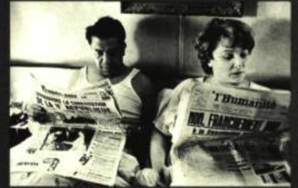
Tout le monde n'a pas eu la chance d'avoir des parents communistes