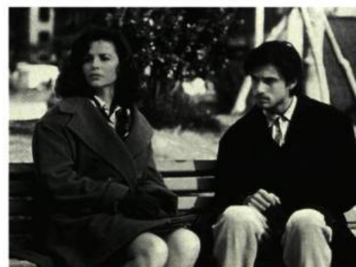
Sans la peau

Thierry Frémont en pleine démente et irritablement agaçant. En fin de compte, on s'en fout de cette histoire racontant les déboires de trois frères qui se retrouvent lors de la sortie de prison de l'un d'eux.