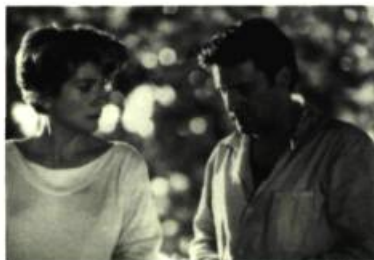
Ma saison préférée