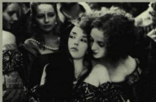
La Reine Margot