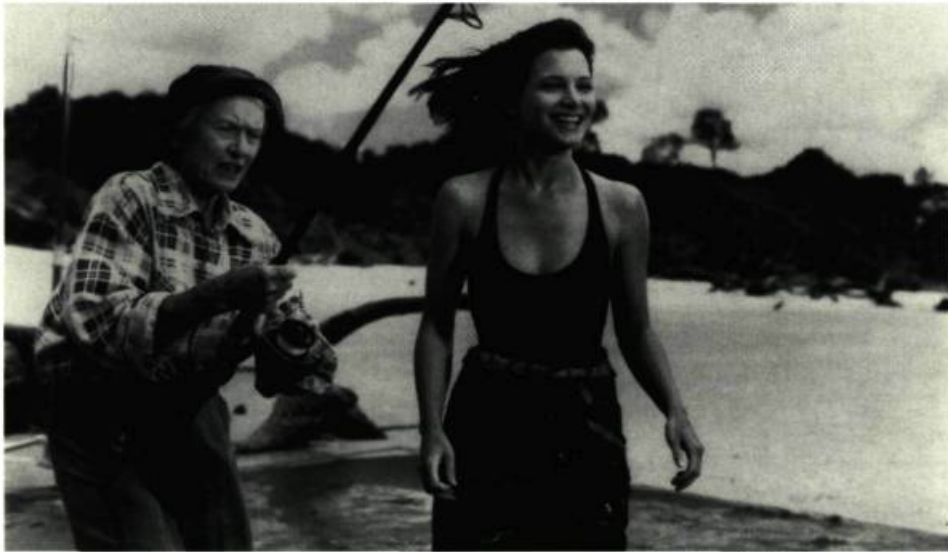
Jessica Tandy et Bridget Fonda dans Camilla

n'avait pas entre-temps disparu. Le seul questionnement devant lequel se trouvera le spectateur à la fin de la projection sera purement d'actualité, genre: de Camilla ou de Nobody's Fool , lequel aura été le dernier film de l'épouse fidèle de Hume Cronyn?