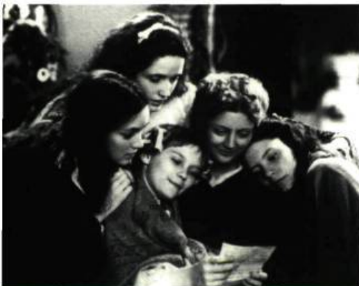
Winona Ryder, Trini Alvarado, Kirsten Dunst, Susan Sarandon et Claire Danes

Fidèle à elle-même, Gillian Armstrong a réalisé cette troisième adaptation du roman célèbre de Louisa May Alcott avec toute la souplesse, le feu, l'attention aux détails et l'impeccable direction d'acteurs qui ont fait la renommée de My Brilliant Career , son premier long métrage. Non pas que sa version de Little Women , quoi qu'en dise la critique américaine, soit meilleure que celle de Cukor (1933), qui brillait par la présence de Katherine Hepburn, ou celle de LeRoy (1949), dont le sans-gêne du sous-texte lesbien m'étonnera toujours, mais elle est certes fort différente. Tout le monde y gagne au change. On remarque ainsi, pour la première fois, qu'on a fait l'effort d'expliquer la genèse de ce récit autobiographique, en mettant dans la bouche de son héroïne