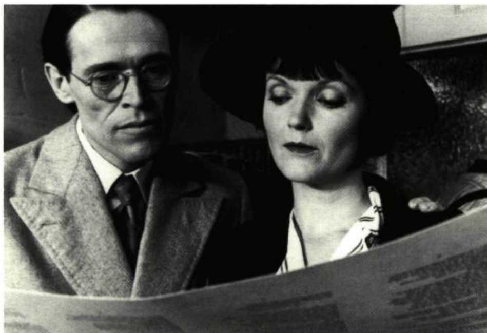
Willem Dafoe et Miranda Richardson dans Tom & Viv