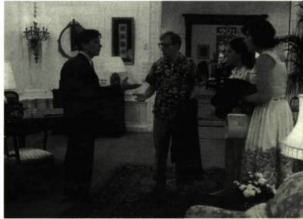
Michael J. Fox, Woody Allen, Mayim Bialik et Julie Kavner

Il avait toujours refusé de passer au petit écran, mais il l'a finalement fait. Peut-être un jour, qui sait, ira-t-il en personne chercher un nouvel Oscar en territoire ennemi.