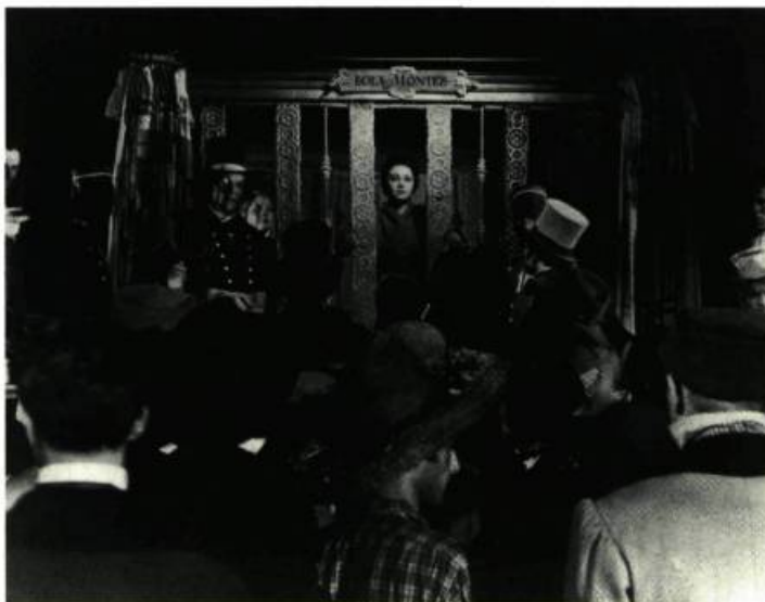
Peter Ustinov et Martine Carol

Admiré inconditionnellement par les uns et méprisé par les autres, Lola Montès risque à cette époque de tomber dans l'oubli. Les copies originales