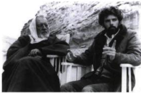
Alec Guinness et Georges Lucas

Si le transfert de l'image est impeccable, surpassant tout ce qui précède, reproduisant adéquatement le cadrage Panavision en format letterbox 2 , que dire du rendement sonore ambiophonique, totalement renversant! Il nous permet d'ailleurs de constater combien la qualité sonore diffère de film en film. On peut littéralement suivre le progrès de l'enregistrement et du mixage au cours des six années qui séparent le premier (1977) du dernier (1983). Star Wars , le plus vieux des trois films et le plus endommagé, a été entièrement remixé à partir de trois éléments sonores différents. Ben Burtt, le génial concepteur sonore des trois films, a pu se permettre d'ajouter quelques effets d'ambiance,