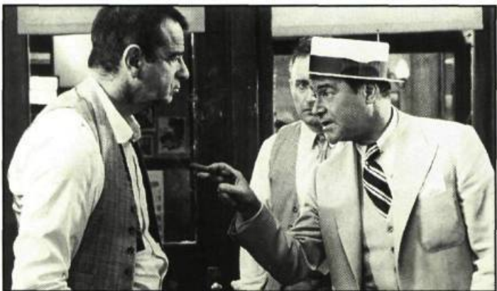
The Front Page

Mais le sujet de prédilection des scénaristes américains lorsqu'ils se penchent sur le genre journalistique reste encore et toujours la presse à sensations. On ne compte plus les films qui dénoncent les travers de cette