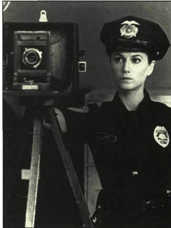
Holly Hunter dans Arizona Dream

C'est cette détermination innée qui l'a fait lentement mais sûrement s'adapter à l'univers de la scène et du cinéma, dès sa sortie de l'université.