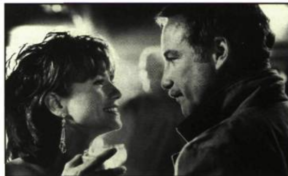
Holly Hunter et Richard Dreyfuss dans Always

de là, qu'emprunter une courbe ascendante.