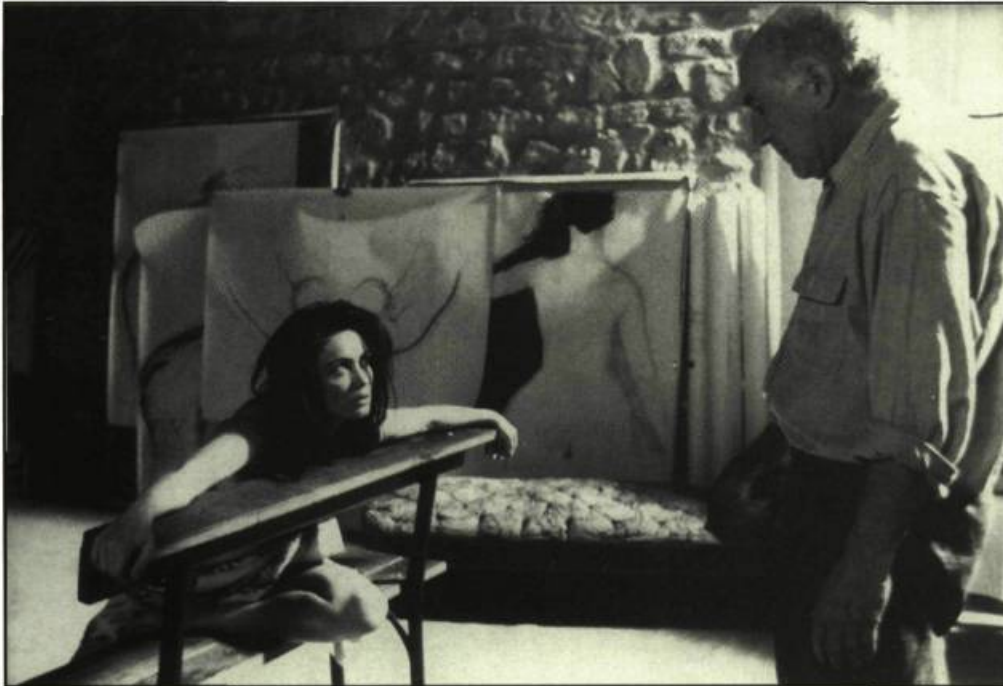
Emmanuelle Béart et Michel Piccoli dans La Belle Noiseuse

— Non. Je crois que d'abord, dans un premier temps, il y a une véritable histoire d'amour. Et ce qui est bouleversant, c'est que, de temps en temps, quand Paul se réveille, il y a quelques moments de lucidité et qu'il arrive à communiquer aussi bien avec Nelly qu'avec les autres. Mais on sent aussi chez lui cette espèce de peur malade de l'abandon. Au fond, Nelly a reçu une éducation judéo-chrétienne qui l'oblige à ne pas l'abandonner, à tolérer Paul davantage.