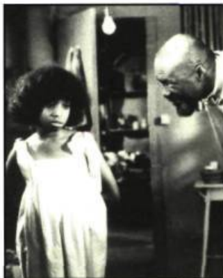
Siméon d'Euzhan Palcy

rhum. Avant son incinération, Orélie, une petite fille de dix ans, conserve une relique convoitée par la dame de feu. Ce qui provoque l'apparition de celui qui personifie l'esprit de la musique créole. Siméon , c'est un rendez-vous avec les esprits musiciens. La caméra ne sait plus où donner de la couleur. Ça tam-tamise , ça tambourine, ça cyclone et ça zouke ! Un film qu'on savoure comme un bouillon de fantaisie. Il y a là matière à faire danser une dépression nerveuse.