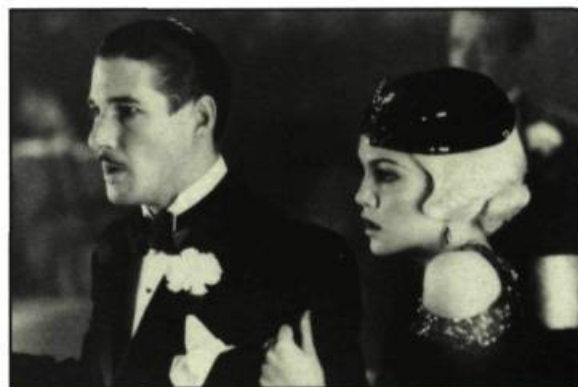
Richard Gere et Diane Lane dans The Cotton Club

Richard Gere est né le 31 août 1949 à Philadelphie, mais il a vécu la majorité de son enfance et de son adolescence à Syracuse, dans l'État de New York. Très tôt, il s'intéresse à la