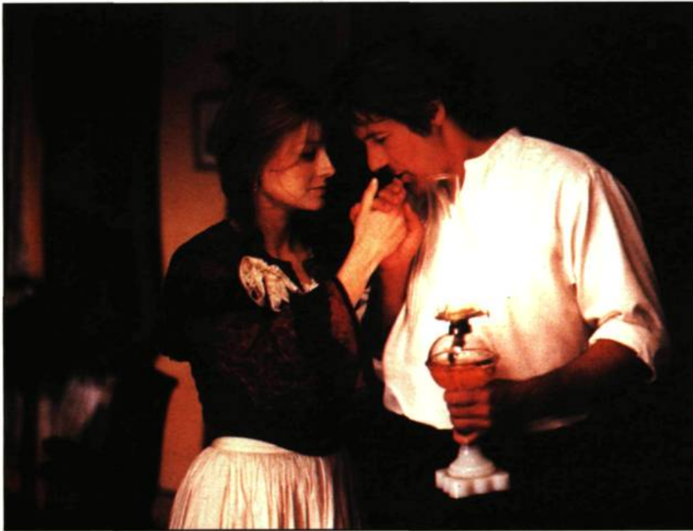
Sommersby de Jon Amiel

risquait de dominer tous les autres. « C'est le rêve de tout acteur que de rencontrer un personnage comme Peck », avoue Gere. En fait, bien qu'il soit un monstre, Dennis Peck devient un personnage charismatique et séducteur.