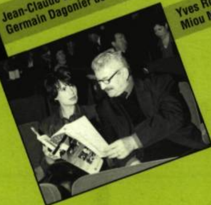
Yves Robert et Miou Miou.