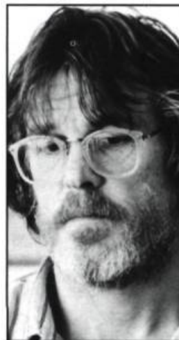
New York Story (1989)