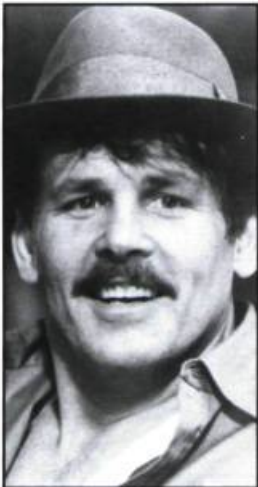
Cannery Row (1982)