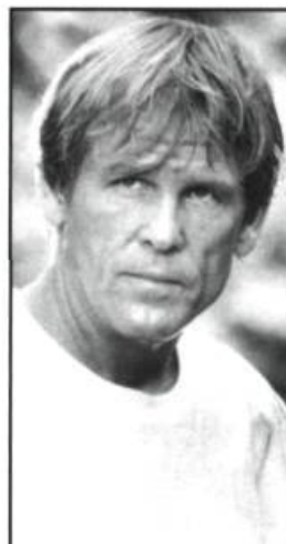
The Prince of Tides (1991)