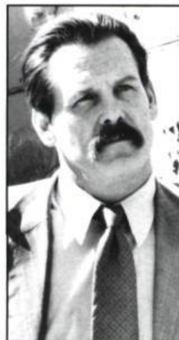
Q & A (1990)