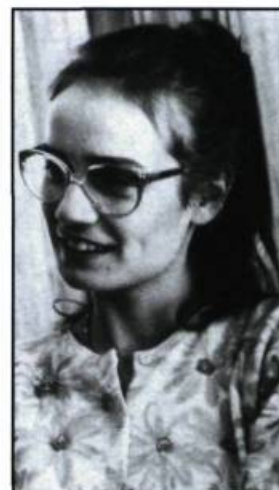
Jaune revolver (1988)