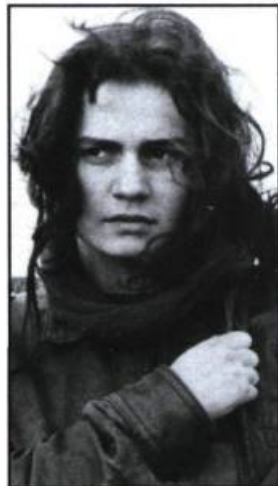
Sans toit ni loi (1985)