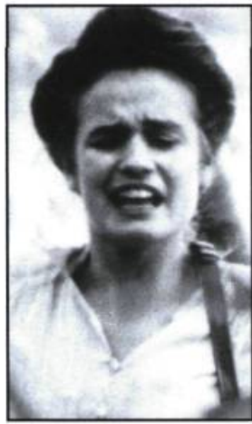
Blanche et Marie (1985)