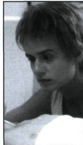
Les Innocents (1987)