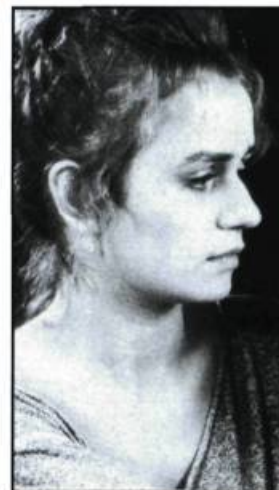
Quelques jours avec moi (1988)