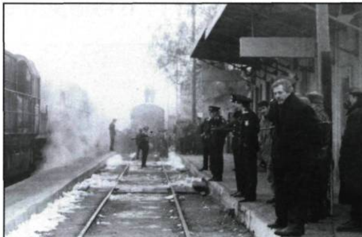
Le Pas suspendu de la cigogne