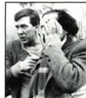
Une journée en taxi

— Le 15 avril 1991. Il sera sans doute dans certains festivals. Et il devrait être sur les écrans d'ici l'automne prochain.