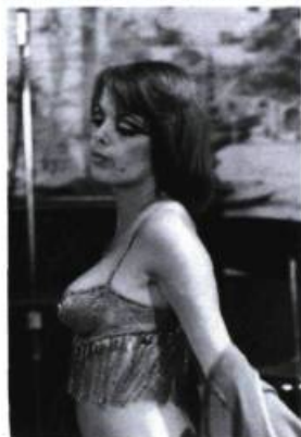
Taureau de Clément Perron