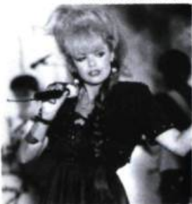
Mes meilleurs copains de Jean-Marie Poiré

— Quelqu'un qui est passionné par ce qu'il fait. Quelqu'un qui a le contrôle, qui est leader. Je pense qu'il faut être maître de soi pour être réalisateur de films. Il doit tenir l'équipe, les producteurs, le budget, l'oeuvre, la vision intérieure du film.