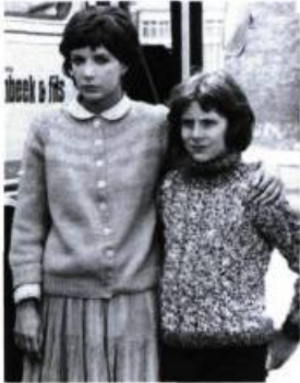
Préparez vos mouchoirs

faire du film « grand public ». À l'occasion de la sortie de Tenue de soirée , vous disiez que, pour vous, le public américain est plus attentif aux « atmosphères » dans un film. Et vous disiez des Français, au sujet de ce même film: « Je suis sûr qu'ils vont se marrer au départ parce que c'est encore assez lesté et décontracté et qu'il va falloir un bon moment avant de comprendre que ce n'est plus le moment de rire. Le spectateur français est trop habitué à rire. » Or, pour Tenue de soirée et Trop belle pour toi! films éminemment riches en scènes poignantes, le « grand public » a ri à gorge déployée d'un bout à l'autre. Pourtant, Blier n'est pas Zid! Il y a erreur sur la personne?