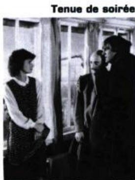
Tenue de soirée

— Non, je crois que ça vient d'un point de vue esthétique, d'une certaine rigueur que j'ai, qui consiste à refuser toutes les fins qui ressemblent justement à des fins classiques. Parce qu'il est très facile de faire des fins. Quand on ne sait pas comment finir un film, on a toujours cinquante solutions. Ça m'est arrivé sur Tenue de soirée . C'était un film qu'on ne pouvait pas finir parce qu'on ne pouvait pas porter de jugements sur ces personnages. Une fin, c'est un jugement, une prise de position. Je ne pouvais pas finir, mais j'avais cinquante fins. Il y a une conclusion finalement, mais c'est la plus difficile de toutes. Je l'ai choisie parce qu'elle m'apparaissait la plus honnête envers les spectateurs et envers ces personnages qu'on ne pouvait pas punir. Donc, j'ai opté pour une fin « fuite », et le problème de ces hommes qui voudraient être des femmes, avoir des enfants. J'ai eu raison, et je crois que c'est une fin difficile à avaler pour les gens. Une fin dérangerante.