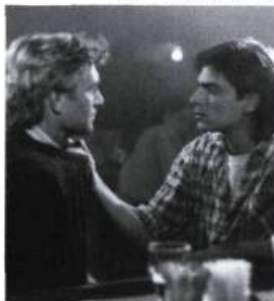
À corps perdu

— Il fait ses adieux. On trouve quatre scènes d'adieu dans le film. 1. à David quand il va l'embrasser dans le café; 2. à Sarah quand il l'embrasse sur le ventre; 3. à Quentin en lui écrivant; 4. à sa mère. Il lui fait ses adieux de façon à lui faire grand plaisir. Il fait exactement ce que sa mère attend de lui. J'aime bien cette scène parce que c'est une scène où Pierre est capable de rire de lui-même, bien que tout aille plutôt mal pour lui.