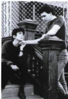
La Femme de l'hôtel

— Pierre est à la recherche de Sarah et David. Son amour est-il plus fort pour David que pour Sarah?