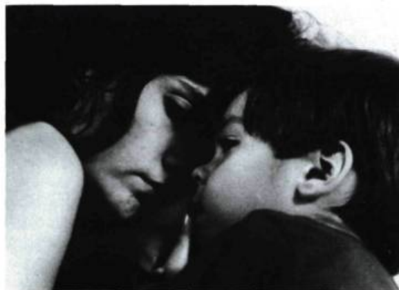
Mon cher sujet