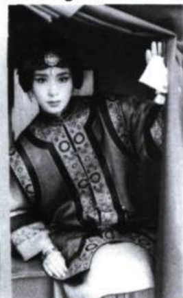
Rouge of the North