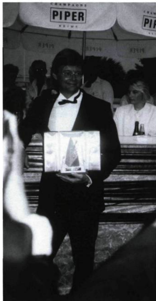
Bille August gagnant de la Palme d'or

Le Jury oecuménique décerne une Mention spéciale au film franco-canadien Les Portes tournantes pour la sensibilité avec laquelle il aborde la situation de l'enfant dans une famille désunie et celle de l'artiste dans un monde en mutation.