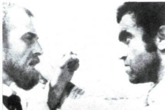
La Migration des moineaux

Le premier a été réalisé par Teimouraz Bablouani, un cinéaste géorgien. Même si ce film, commencé en 1979, n'a pu être complété qu'en 1986, il ne ressemble en rien à ceux qui sortent des voûtes soviétiques depuis que le « glasnost » transforme tout ce qui a été banni