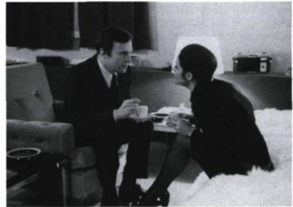
Ma nuit chez Maud

Jérôme déclare ne pas prêter attention à l'amour qu'éprouve la jeune Laura à son égard. De même Jean-Louis insiste sur le fait que « courir les filles, ça ne vous éloigne pas plus de Dieu que faire des mathématiques ». Pourtant, le premier, tout en étant troublé, obsédé par le genou de Claire, accompagne volontiers Laura dans ses promenades et ne manquera pas l'occasion de l'embrasser. Le second poursuit Maud de ses assiduités, l'embrasse aussi, presque comme pour se faire pardonner sa maladresse de la nuit précédente. Des hasards bien préparés, menant à des actions attendues jouées sur le ton badin de l'improvisation la plus naturelle.