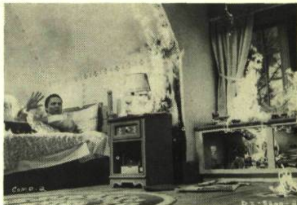
Dead Zone de David Cronenberg

Salem's Lot , enfin, a été tourné en une dramatique de six heures par Tobe Hooper avec respect et intelligence. Second roman de King, Salem's Lot est parti d'une nouvelle que l'amateur pourra retrouver dans le recueil « Nightshift » (qui vient de faire l'objet d'une réédition). Le roman explique et raconte les événements horribles dont la maison des Marsten fut le théâtre. Et Hooper, donc, avec un excellent et fidèle scénario de Paul Monash, ainsi qu'une excellente distribution dominée par un James Mason en pleine forme, n'avait pas raté son coup. C'est pourquoi je me dois de signaler qu'une présentation, mutilée et frustrante, est disponible en vidéocassette sous le titre Salem's Lot: The Movie . C'est à la fois de la fausse représentation et une insulte de présenter les six heures de Hooper dans une version de deux heures (...), montée à l'emporte-pièce et diffusée avec l'audace de l'ignorance.