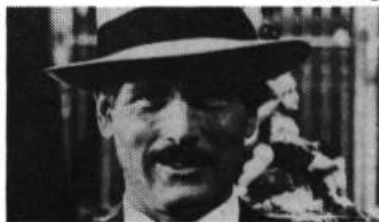
Fort Apache, the Bronx