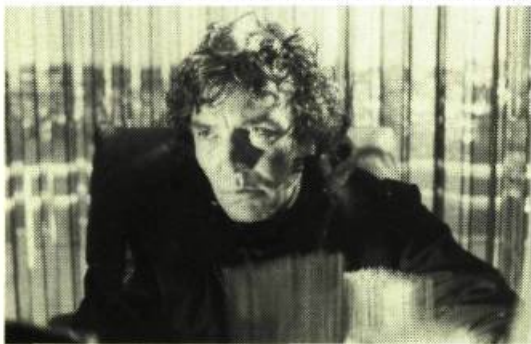
Wadleigh Wolfen , de Michael Wadleigh

tir à travers les yeux et le cerveau des loups, communiquant au spectateur, avec une rare intelligence, la vision, la rapidité et les démarches du loup, l'identifiant du même coup aux vrais héros de l'histoire, tour de force habile et peu commun.