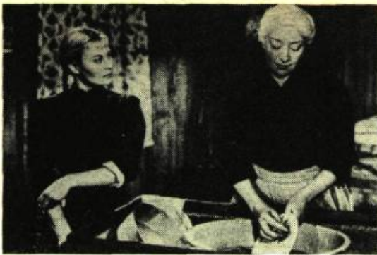
Michèle Morgan et Françoise Rosay

protégé de Gide, Roger Vadim? Françoise Rosay incarnera donc une mère Chapdelaine bien désenchantée et philosophe. En mourant, elle expose sa philosophie à Maria: «Le bonheur, il faut le construire heure par heure, jour par jour, et on ne connaît sa force qu'avec le temps.» Morale qui rejoint le roman par l'universalité et la philosophie gidienne! Quant à la Maria de Michèle Morgan, elle a bien envie d'envoyer promener le curé.