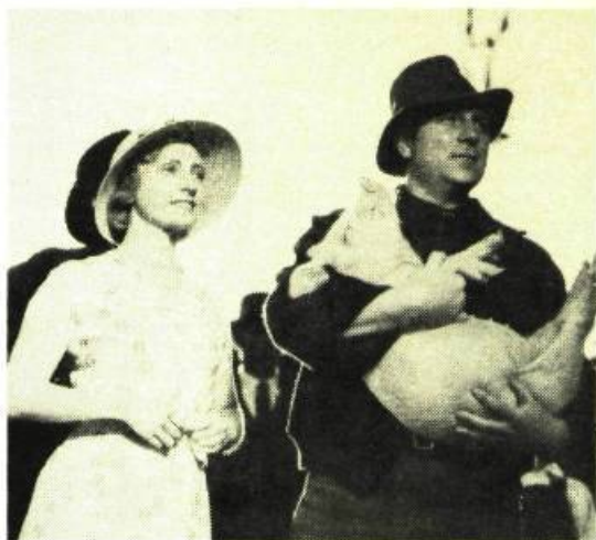
Madeleine Renaud et Jean Gabin.

Pour la localisation dans le temps, bien qu'on ne voie aucune automobile (sauf dans les plans de ville) et que les costumes du père, de la mère, d'Eutrope, de François, de Nazaire et