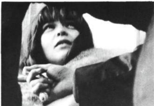
Le Retour de l'Immaculée-conception

A.F. - Je ne sais pas. Peut-être à cause du miracle qui se trouve dans le film.