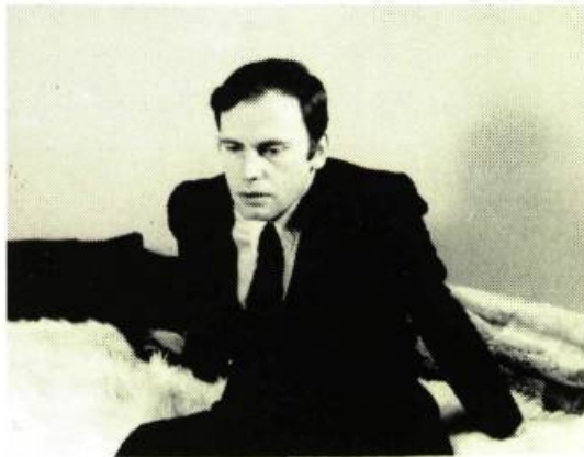
Ma Nuit chez Maud

E.R. - Si vous voulez dire qu'il y a une unité de lieux et que l'on ne passe pas continuellement d'un lieu à un autre, je suis d'accord. Mais, dans le cinéma, il y a des films qui se sont tenus dans un seul lieu et qui comptent parmi les films les plus cinématographiques. Aussi je me refuse de considérer que mes films ont un côté théâtral parce qu'ils ne va-