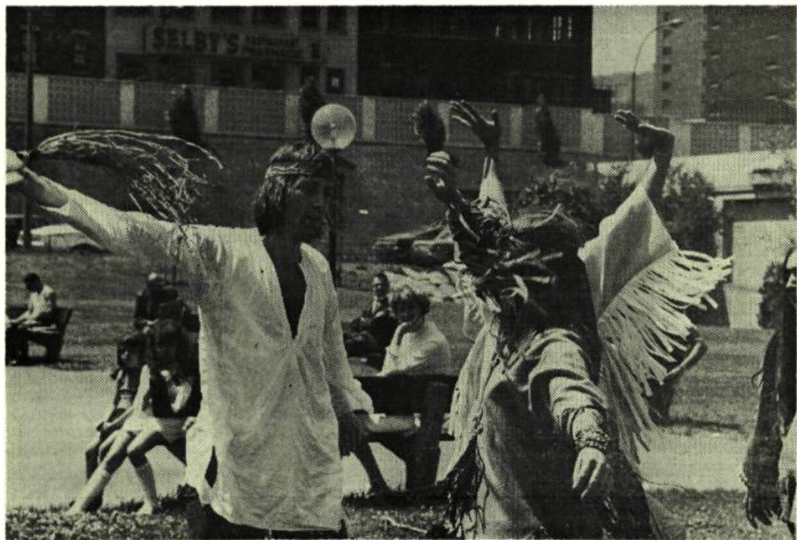
Ty-Peupe, de Fernand Bélanger