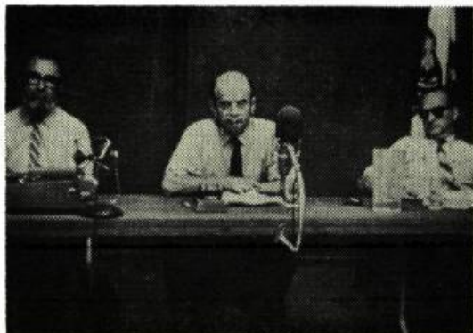
Punishment Park , de Peter Watkins

On connaît des films gratuits qui sont Inutiles à quelque chose . J'avoue ne pas pouvoir aimer des films utiles à rien .