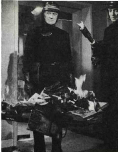
Fahrenheit 451, de François Truffaut

De toute façon, il existe encore chez ceux qui vivent du fantastique, disons les science-fictioneers , une confusion notable sur une classification authentique du genre. Qu'est-ce que la science-fiction? Certains avanceront une définition qui sera contredite par d'autres, comme en témoigne une enquête organisée par la revue italienne Cinema domani auprès des spécia-