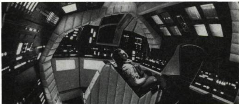
2001 : a Space Odyssey, de Stanley Kubrick