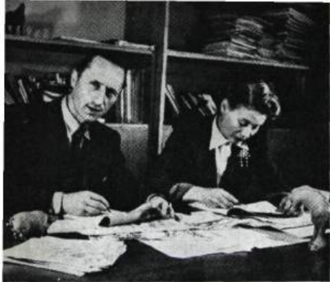
John Halas et Joy Batchelor

sous leur dépendance près de soixante-dix dessinateurs et techniciens venus pour un bon nombre de Californie. Il va sans dire que leur formation a été plus au moins influencée par Disney. La guerre fournit à John Halas et à Joy Batchelor leurs premières occasions réelles de travail. Ils suivirent l'exemple de leur compatriote Len Lye qui réalisa, durant le conflit mondial, le fameux Lambeth Walk , film antihitlérien qui exploite, par un jeu habile de montage, un documentaire sur la Wehrmacht et rend ridicule le pas de l'oie en faisant avancer les soldats d'un pas en avant alors qu'ils reculent de deux en arrière. Les époux Halas et Batchelor travaillèrent donc eux aussi pour les combattants et réalisèrent des films didactiques sur le métier des armes ou sur la prévention des maladies que les soldats pouvaient contracter dans les pays tropicaux. Rappelons à ce su-