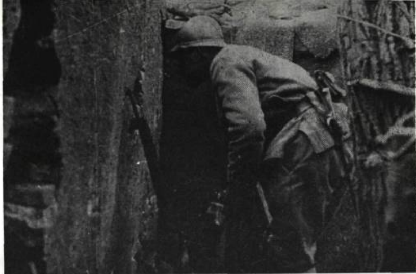
14-18, de Jean Aurel