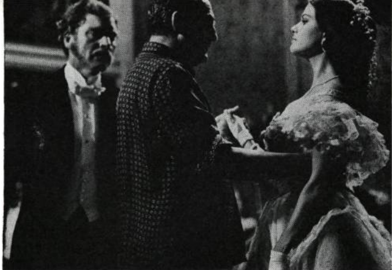
Luchino Visconti, pendant le tournage du Guépard

l'homme est lié à une destinée sociale. Toute l'œuvre de Visconti véhicule le thème de la transformation du monde social. Ses héros sont généralement des vaincus mais des vaincus qui ont appris à lutter, à braver, à s'affirmer. Et les luttes constantes, les défaites successives conduisent malgré tout à une victoire définitive. C'est donc dans la lutte que se révèlent les êtres, c'est dans l'affrontement qu'ils existent vraiment. C'est pourquoi il y a toujours des moments de crise dans la conscience des personnages de Visconti. Voyez ces ouvriers ( Ossessione ) qui désespérément luttent contre leur condition inhumaine, voyez ces pêcheurs ( La