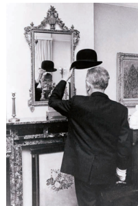
Figure 4 - Référence photographique inconnue

Les foyers de cheminée sont fonctionnellement et esthétiquement destinés à accueillir des flambées et à être des endroits où l'on se réchauffe. C'est ainsi que jadis les âtres étaient "habitables". Quand leur taille s'est adaptée aux pièces plus petites de l'habitat urbain, les usagers ont continué à s'en approcher pour profiter de leur chaleur. S'accouder sur leur manteau pour se réchauffer et contempler le feu est devenu une habitude toujours courante. Cette habitude et l'attitude qui en résulte ont été exploitées tant par la peinture que par la photographie pour présenter des scènes de la vie quotidienne ou des portraits. La cheminée fonctionne alors comme un accessoire contextualisant ou comme une pièce d'apparat mais aussi comme une figure de la pose dans les systèmes de représentation. C'est ainsi que James pose devant la cheminée dans La reproduction interdite et que nous connaissons au moins quatre photographies de Magritte ou représentant Magritte posant devant ou à proximité de cheminées (cf. fig. 4).