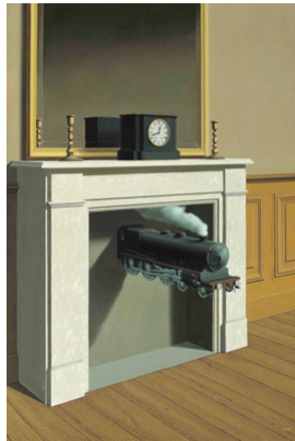
Figure 1. René Magritte — La durée poignardée . Huile sur toile, 140 x 97.5, 1938. The Art Institute of Chicago

“Dans les plus sombres yeux se ferment les plus clairs” 2 - Paul Éluard (1924 : 166)