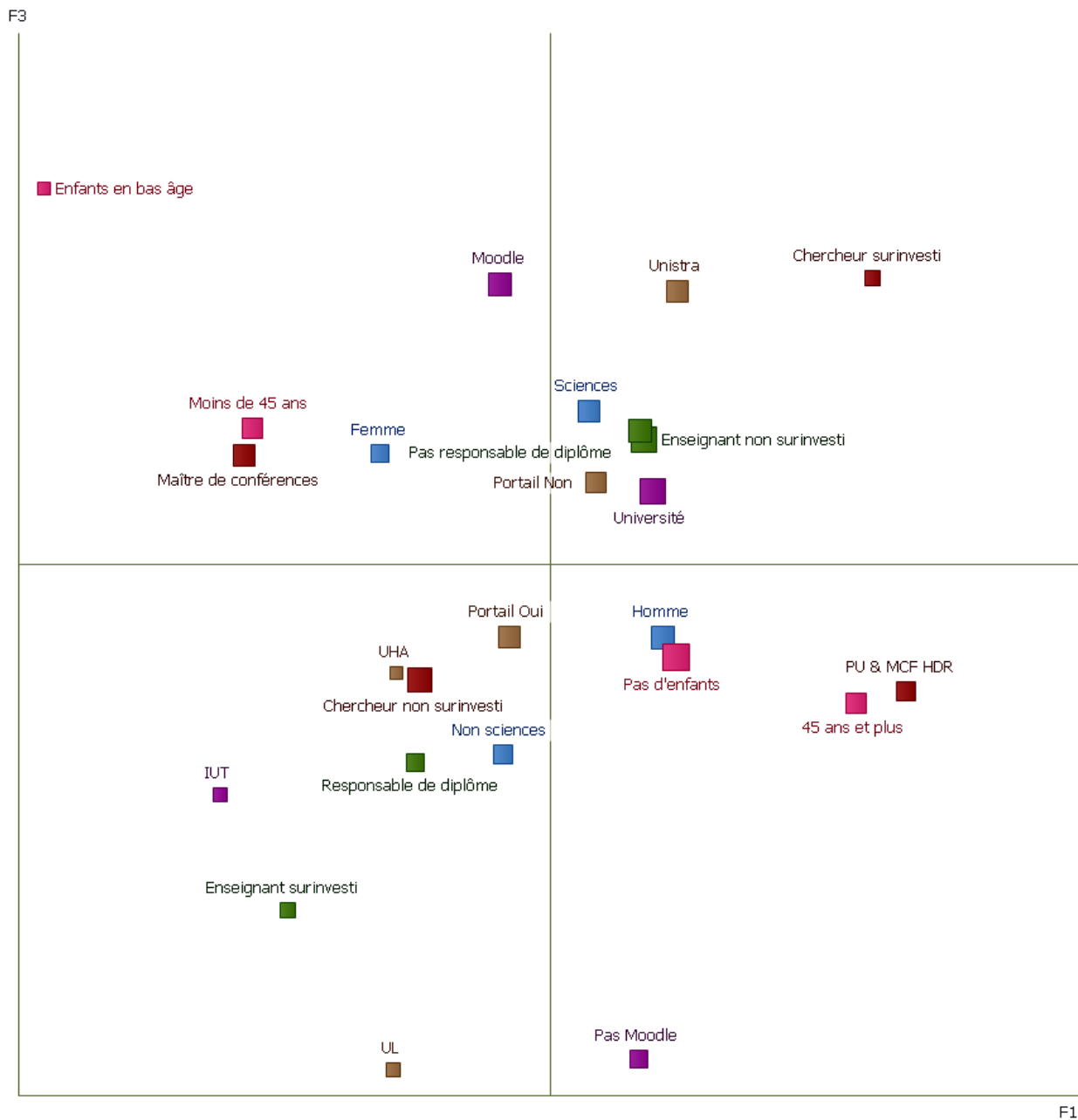
Figure A-2 Carte2 : axe 1 et axe 3