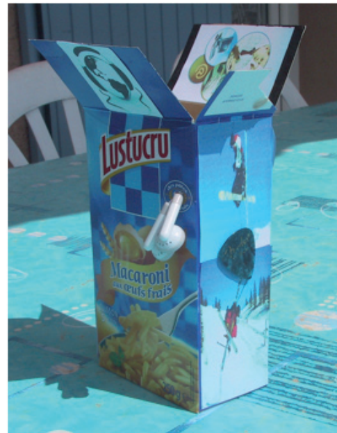
Figure 1. Exemple de production de « la boîte qui me représente »