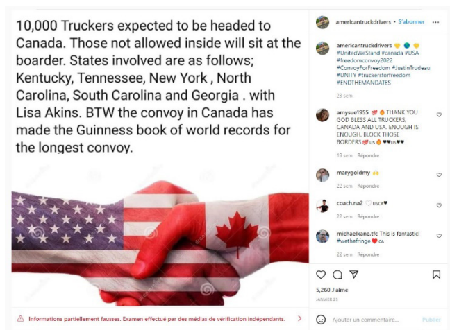
Figure 3- AmericanTruck Drivers, Guinness

Mais, sachant qu'une fausse nouvelle circule plus rapidement qu'un fait établi (AFP, 8 mars 2018) 18 , ces vérifications de faits ont bien des limites 19 en raison du clivage grandissant des opinions (Figeac et al., 2019). Figeac a expliqué que les algorithmes des moteurs de recherche tendent à trier, sélectionner et rendent visibles certaines sources d'informations, captant l'attention des internautes vers un petit réseau de sites web.