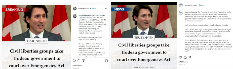
Figure 4 - BRock «scoop» le média indépendant True North

Les agents de circulation d'information comme le compte BRock ont relayé en masse la poursuite lancée contre le premier ministre Trudeau par des organismes « indépendants » caritatifs comme la Canadian Constitution Foundation , qu'un article paru sur CBC News (Crowe, 2015) associait à des sources de financement américaines avec d'autres « think tanks » de droite. À la figure 4, on retrouve une nouvelle qualifiée par la suite de « mésinformation » par des chercheurs dans la publication universitaire The Conversation (Dishart et al., 2022) en raison de l'utilisation d'un langage « pseudo-légal » qui a même berné des médias canadiens reconnus, comme le National Post ou le Toronto Sun . Il est à noter ici que le compte de BRock a publié cette exclusivité de l'organisme True North avant même le compte Instagram @truenorthcentre. Or, si la nouvelle de True North n'apparaît pas dans la liste des publications les plus vues sous les hashtags #FreedomConvoyCanada et #FreedomConvoyCanada2022, c'est que ce média indépendant d'enquête n'utilise jamais de hashtags .