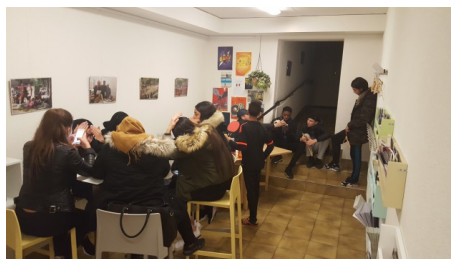
Les accueils libres jeunes au Centre socioculturel de Prélaz-Valency.

Par contre, pour l'équipe de professionnels du Centre, l'animation socioculturelle et, donc, le travail vers la jeunesse, sont des outils de prise de conscientisation pour le changement social. Ces deux sens n'ont pas su, au cours des années, se composer en une signification commune et même leur cohabitation se manifeste laborieuse d'autant plus que les jeunes tendent à reproduire au Centre les pratiques agressives qu'ils vivent à l'extérieur.