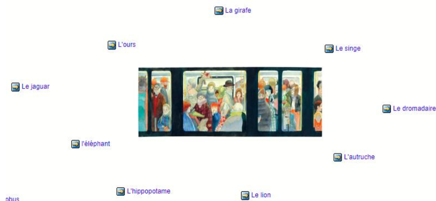
Schéma 1 : Liens vers les perspectives du champ lexical de chaque animal

Dans la séquence, à la phase de planification, les élèves ont créé des cartes d'idées en prévision de la rédaction du texte individuel. Le travail a été réparti entre les élèves de chacune des classes afin d'enrichir le champ lexical de chaque animal. Le schéma 1 présente l'organisation des liens vers les perspectives de chaque animal pour élaborer le champ lexical permettant aux élèves des deux classes d'inscrire leurs idées dans le KF. Les schémas 2 et 3 illustrent respectivement une représentation de notes autour du champ lexical de la profession d'un animal ainsi que deux exemples d'utilisation d'échafaudages par des élèves.