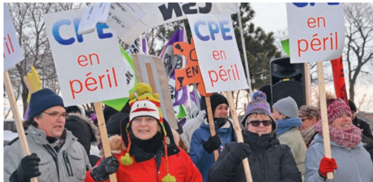
Manifestation à Montréal devant les bureaux du ministère de la Famille pour dénoncer les compressions dans les CPE, le 12 janvier 2016.

Le succès des CPE a été instantané: le taux d'activité des femmes a augmenté, la pauvreté chez les mères monoparentales a diminué, et il semble même que le réseau ait contribué à accroître légèrement le taux de natalité. Même les économistes concluent qu'il s'agissait d'un bon investissement pour l'État. Une étude de la Banque TD révèle qu'en tenant compte des bienfaits offerts par les CPE et des revenus imposables supplémentaires