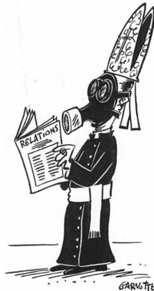
Garbette, paru dans Nouvelles CSN . Encre de Chine sur bristol

Je suis d'accord sur le fait que cette dimension a souvent été laissée de côté. Nous reviendrons sûrement sur les raisons de cet «oubli». Mais c'est précisément dans la réappropriation de cette part oubliée, au moyen