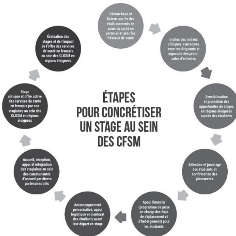
Schéma 1 — Étapes pour concrétiser un stage au sein des CFSM

Le cheminement élaboré et présenté dans le schéma 1 ci-après expose les différentes étapes habituellement suivies par l'équipe du CNFS et ses partenaires. Celles-ci ont favorisé, et favorisent encore, la concrétisation de stages au sein des CFSM.