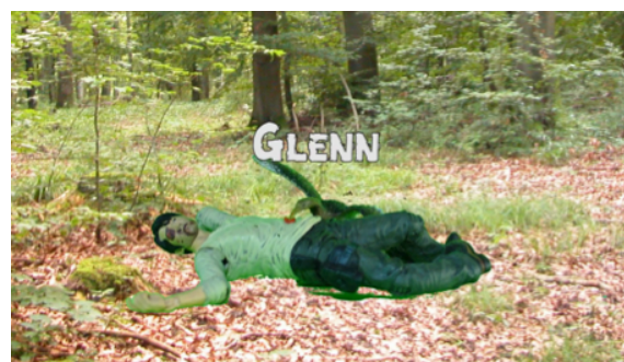
Illustration 2 : Comparaison du devenir posthume de Jon Snow et de Glenn