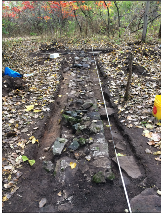
Figure 5 Vestige du mur de la Seigneurie de Robineau de Bécancour sur l'île Montesson, 2017

La recherche archéologique permet de mieux comprendre l'occupation et l'utilisation anciennes du territoire, les relations entre colons et W8banakiak et, par les données environnementales, de reconstituer les diètes alimentaires et les cultigènes utilisés, une dimension jusqu'à présent peu documentée. Il est ensuite plus aisé pour le Bureau du Ndinakina de traduire les pratiques des membres de la nation au sein d'une trame historique plus vaste. Lors des processus de consultation, les connaissances archéologiques permettent au Bureau du Ndinakina d'affirmer la présence w8banaki sur le territoire et de recommander des mesures d'atténuation des impacts environnementaux, sociaux ou patrimoniaux d'un projet de développement en respect des pratiques alimentaires, rituelles ou sociales des W8banakiak. Par exemple, lorsque l'analyse de données biophysiques met en relief un enjeu environnemental qui s'avère central lors d'une consultation, le Bureau du Ndinakina peut utiliser les résultats des recherches archéologiques menées jusqu'à présent pour attester l'importance culturelle historique de la