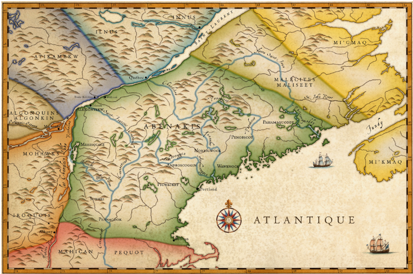
Figure 1 Carte du territoire ancestral w8banaki (© Luc Normandin/Musée des Abénakis)

d'échantillons de charbon et de restes culinaires carbonisés a révélé une occupation continue depuis le XVI e siècle ( ibid. ). Les récentes découvertes effectuées sur la rivière W8linaktekw (Bécancour) semblent démontrer les mêmes schèmes d'établissement. L'analyse de ces récentes données et leurs comparaisons avec les sites d'Odanak, au Québec, ainsi que de Tracy Farm et Old Point Mission au Maine (Narantsouak), appuient la même hypothèse ( ibid. ). D'ailleurs, on retrouve sur le site de Tracy Farm les mêmes artefacts diagnostiques que sur les sites d'Odanak et de Wôlinak. Ces objets ont une attribution temporelle datant du Sylvicole moyen jusqu'à la période de contact (Cowie, Bartone et Petersen 2000).