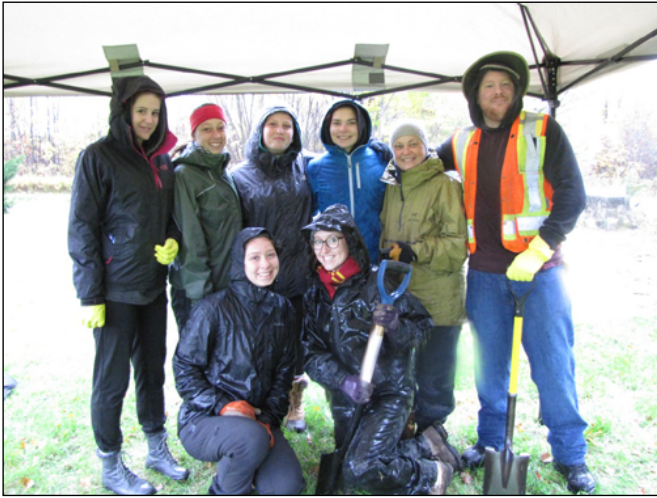
Figure 4 L'équipe de Niona lors du projet de fouilles archéologiques sur la rivière W8linaktekw, 2016

Outre son aspect scientifique et documentaire, ce projet visait à démontrer et affirmer la présence historique des W8banakiak dans la région du Centre-du-Québec, et plus particulièrement dans la région de Bécancour, où le développement d'infrastructures est très présent et les droits d'accès au territoire ancestral remis en question. La mise au jour de sites archéologiques et leur enregistrement officiel dans l'Inventaire des sites archéologiques du Québec permettent donc de défendre les droits ancestraux des W8banakiak lors de discussions et d'échanges avec les différentes instances municipales, provinciales et fédérales. Étant intimement lié à la protection des droits des membres lors de diverses consultations territoriales, ce projet réalisé sur la rivière W8linaktekw (Bécancour) s'avère très significatif pour plusieurs membres de la nation w8banaki et sert à attester sa présence historique sur des territoires d'intérêt patrimonial ou d'intérêt pour les pratiques de chasse, de piégeage, de pêche, de collecte ou de cueillette des W8banakiak.