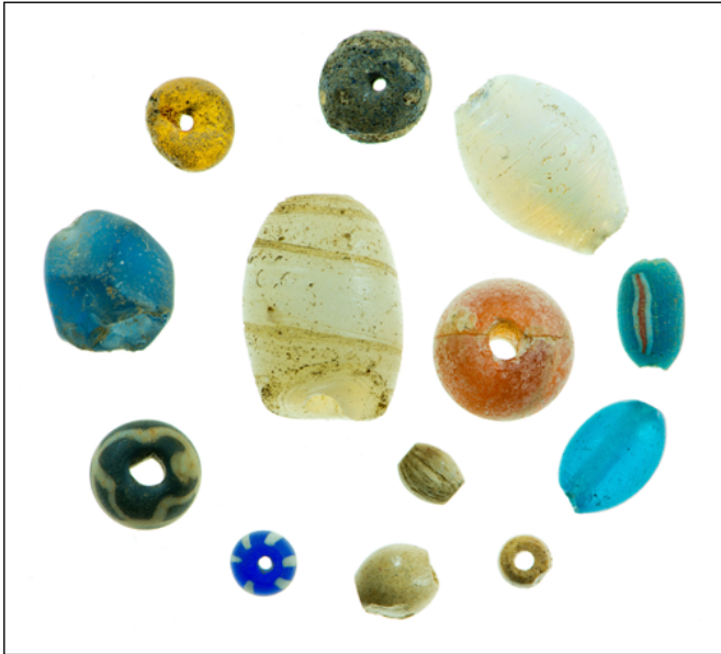
Figure 2 Groupe de perles de verre de différentes périodes (xvii e et xviii e siècles) misés au jour lors des fouilles archéologiques de 2013 et présentées dans l'exposition Fort Odanak : le passé revisité (© André Gill, Société historique d'Odanak)

d'une connaissance approfondie des schémas historiques et actuels d'occupation et d'utilisation du territoire à des fins alimentaires, rituelles ou sociales et d'identifier des sites sensibles pour la protection de leurs droits ancestraux. Ces données sensibles sont utilisées par le Bureau du Ndakinna afin d'évaluer les impacts environnementaux, patrimoniaux et sociaux des projets de développement proposés sur le territoire et ainsi communiquer aux différents promoteurs et instances gouvernementales les préoccupations des membres w8banakiak concernés. Il s'agit pour le Bureau du Ndakinna de consolider et pérenniser ses structures, méthodologies et relations permettant à la nation w8banaki d'affirmer sa présence sur le Ndakinna tout en y assumant de plus en plus des initiatives de direction environnementale et culturelle.